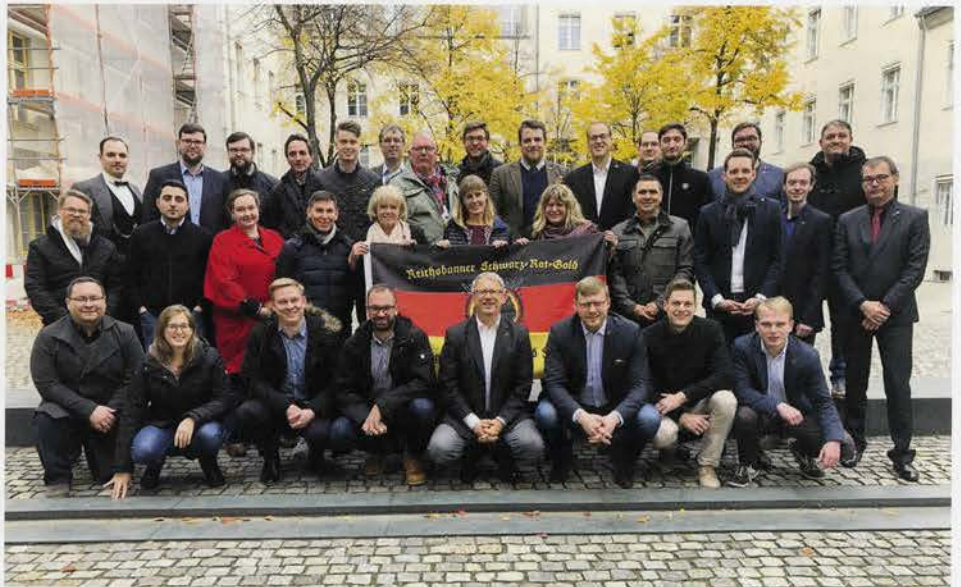
Die Teilnehmer der Bundeskonferenz

Verbandszeitschrift des Reichsbanners Schwarz-Rot-Gold Bund aktiver Demokraten e.V.