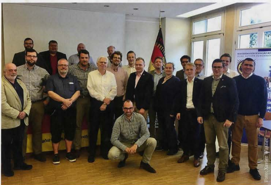
Gruppenfoto des Hamburger Vorstands

Am Sonntag, den 17. Juni 2018 trafen sich die Mitglieder des Reichsbanners Hamburg e. V. im Kurt-Schumacher-Haus zu einer ordentlichen Landeskongress, um einen neuen Landesvorstand zu wählen.