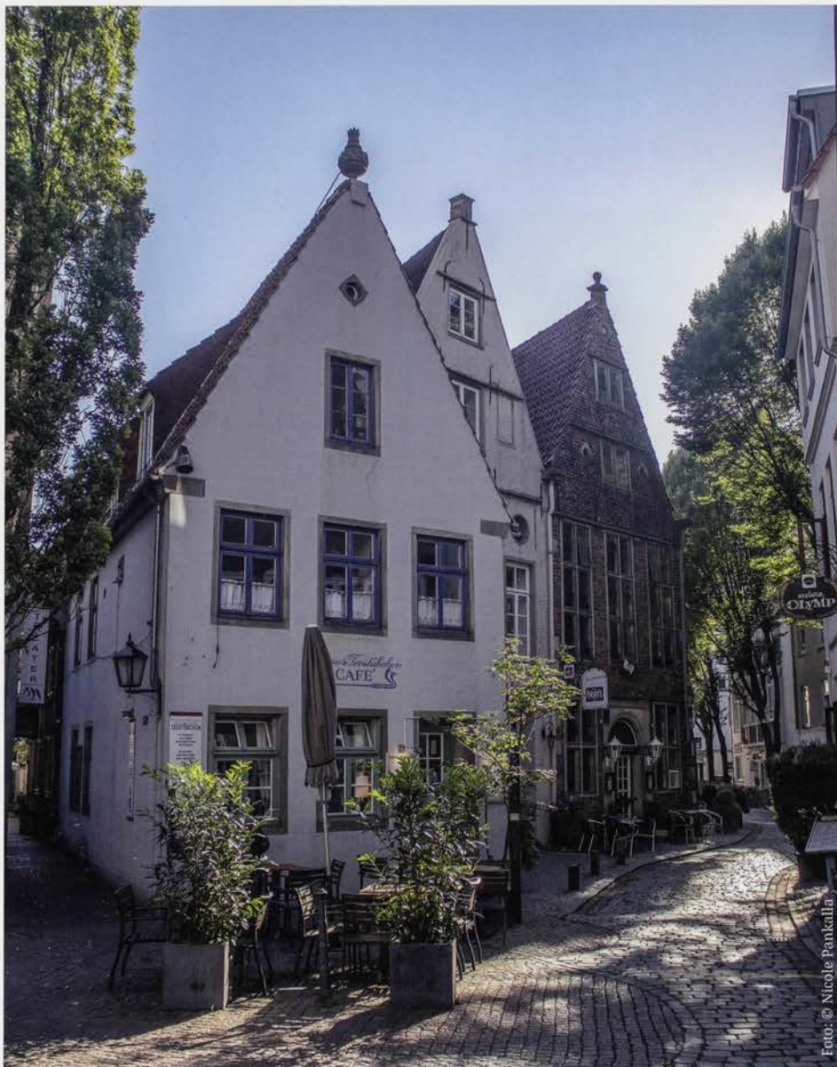
Das Schnoorviertel in Bremen