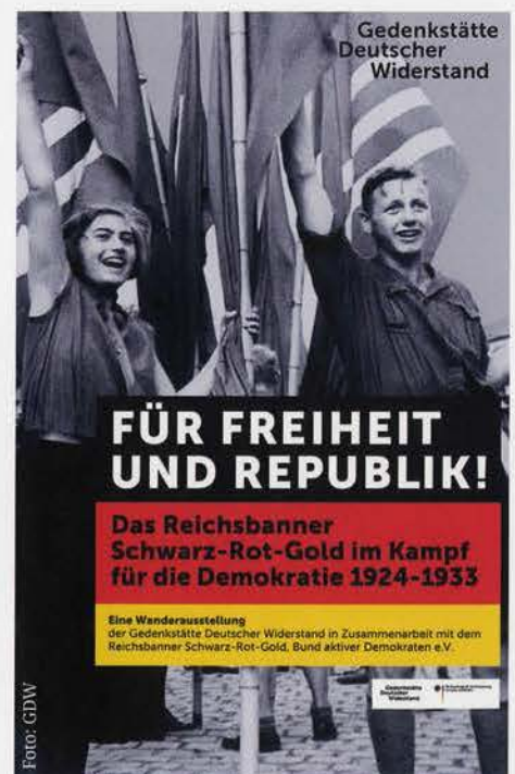
Das Plakat zur Ausstellung, das im Frühjahr 2018 in Berlin zur öffentlichen Werbung verwendet wurde