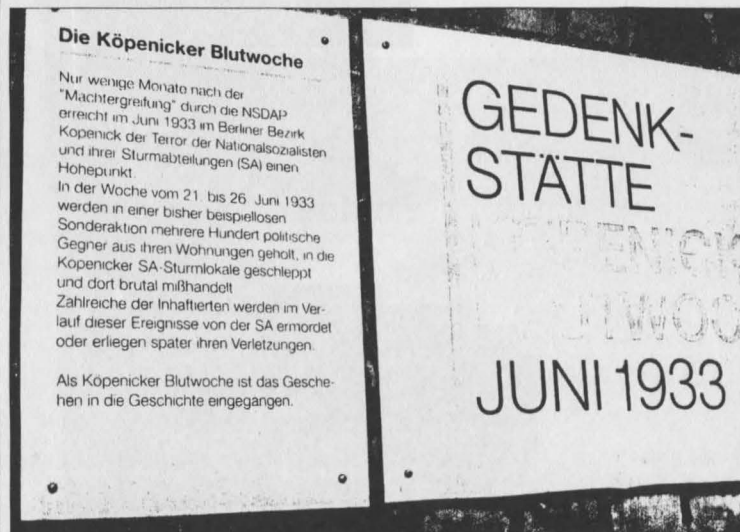
Gedenktafel am früheren Amtsgefängnis von Köpenick.

Dies war eine gute Abwechslung zu den detaillierten und faktenlastigen Führungen in den anderen Museen, wobei ich damit nicht sagen will, dass die anderen Führungen langweilig oder wenig sinnvoll waren. Sie waren ebenfalls sehr interessant und haben unser Wissen nur gefestigt.