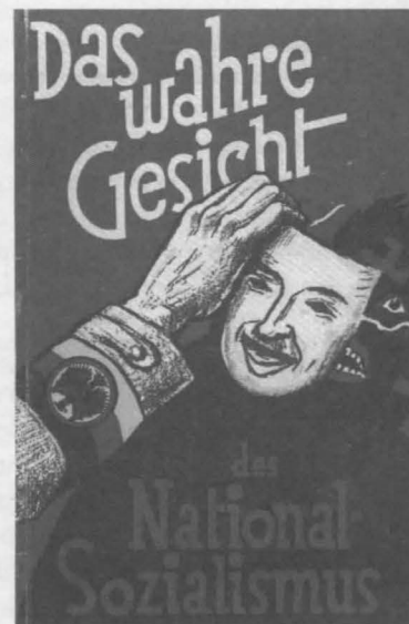
Titelblatt einer Broschüre des Reichsbanners von 1929