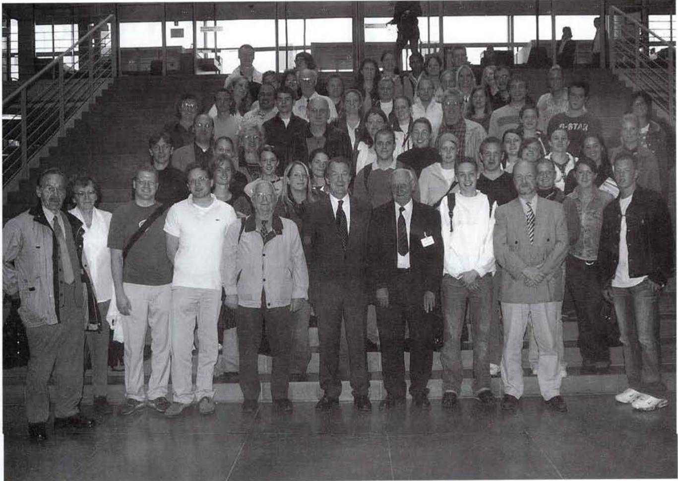
...der Diskussion mit dem SPD-Fraktionsvorsitzenden Franz Müntefering im Paul-Löbe-Haus