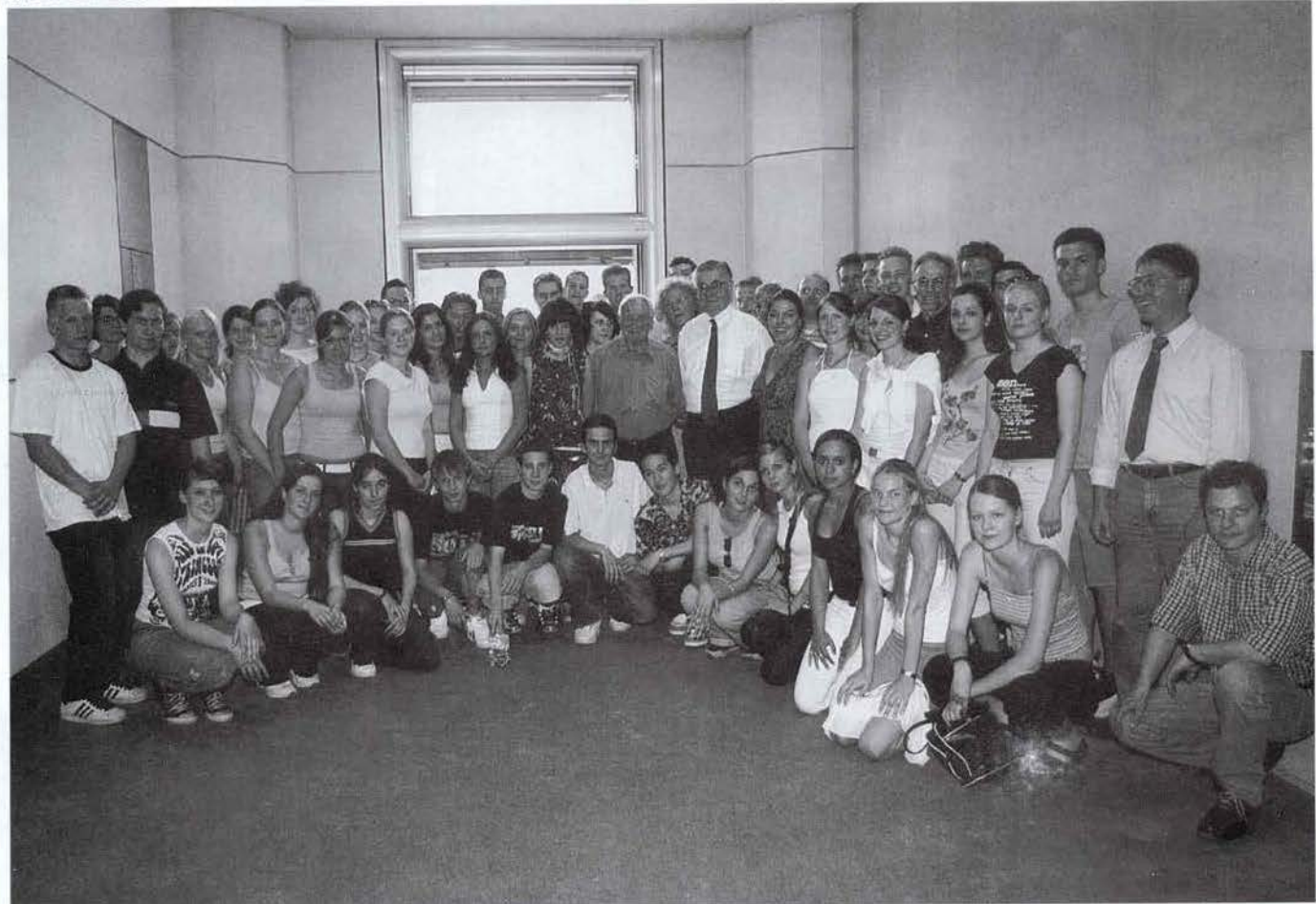
und Hans Koschnik im Reichstag.