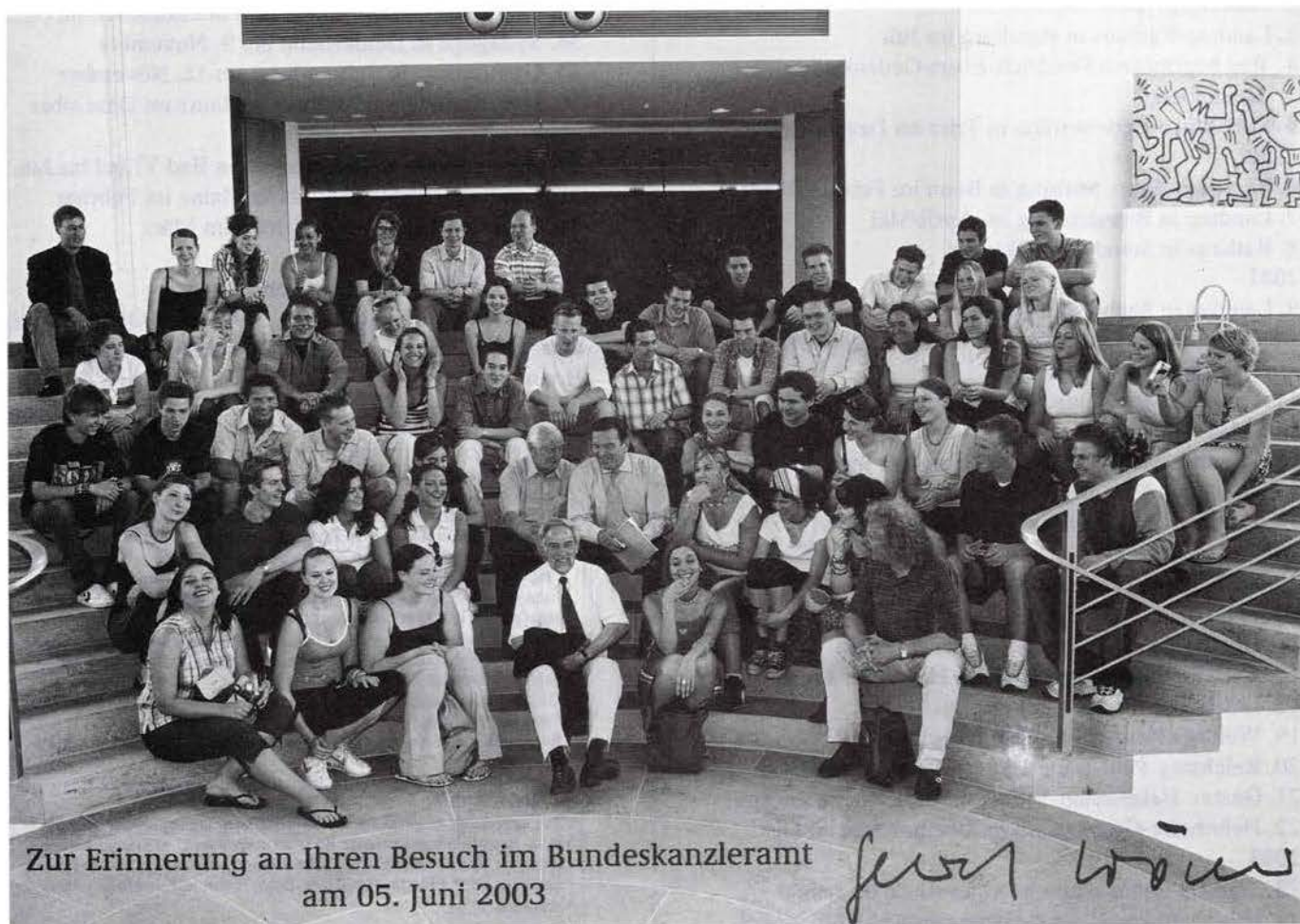
Zur Erinnerung an Ihren Besuch im Bundeskanzleramt am 05. Juni 2003