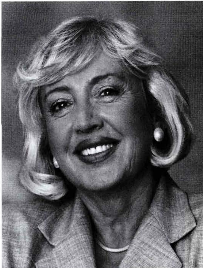
Renate Schmidt, SPD

Bundesministerin für Familie, Senioren, Frauen und Jugend