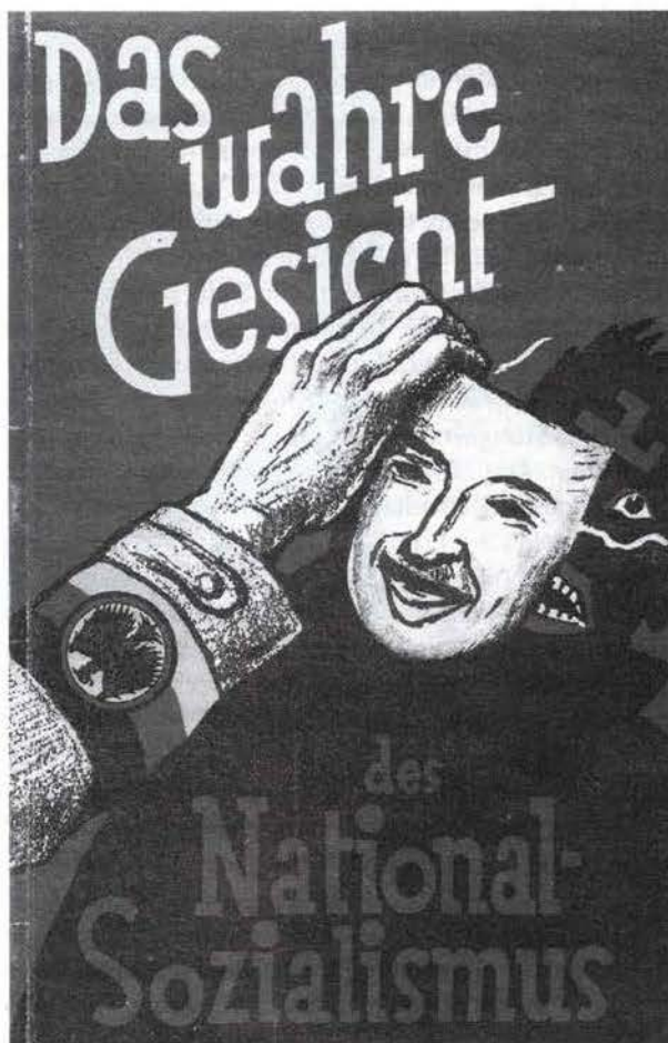
Titelblatt einer Broschüre des Reichsbanners von 1929

Der beabsichtigten Überparteilichkeit waren damit im Gau Württemberg von Beginn an enge Grenzen gesetzt, die sich aus der besonderen politischen Situation in Württemberg am Beginn der Weimarer Republik erklären. Der Gau Württemberg wurde unter der Regierung des deutschnationalen Staatspräsidenten Wilhelm Bazille (1874 bis 1934) gegründet, die aus den Landtagswahlen vom 4. Mai 1924 hervorgegangen war. Seine Mitte-Rechts-Regierung stützte sich auf eine Koalition der Deutschnationalen Volkspartei (Württembergische Bürgerpartei), des eng mit ihr verbundenen Württembergischen Bauern- und Weingärtnerbundes und des Zentrums. Diese politischen Rahmenbedingungen stellten für die Gründung des Gaus Württemberg kein ideales Klima dar. Im Vergleich zu anderen Regionen des Deutschen Reiches waren die politischen Verhältnisse in Württemberg aber dafür sehr stabil, da es auch zu keinen größeren politischen Unruhen kam.