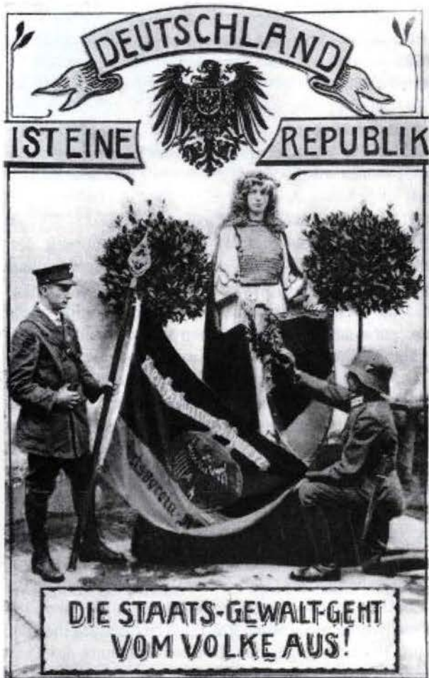
Postkarte des Kampfverbandes

Am 16. August 1924 wurde in Württemberg unter der Überschrift „Republikaner, Kriegsteilnehmer!“ ein Aufruf veröffentlicht: „Seit mehr als vier Jahren kämpft die Deutsche Republik um ihr Bestehen und ihre innere Sicherheit ... Die Ermordung führender Männer, wie Erzberger und Rathenau, hatte den Zweck, der Republik die besten Köpfe zu nehmen ... Unter dem Vorwand nationale Ziele zu verfolgen, haben sich Organisationen gebildet, um den Bürgerkrieg zu entfesseln ... Republikaner! Kriegsteilnehmer! ... Noch immer wird die Republik von innen und außen bedroht! Da ist es Pflicht jedes aufrechten Republikaners, mitzuwirken an den erforderlichen Abwehrmaßnahmen! Die Republik den Republikanern! muß für die Zukunft die Losung sein!“