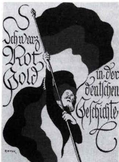
Ernst Jägers Werbeschrift für Schwarz-Rot-Gold als „Kulturhistorischer Beitrag zur Flaggenfarbe“ aus der Weimarer Republik

Den Auftakt dieser Werbearbeit bildeten im Gau