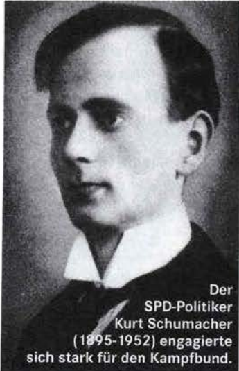
Der SPD-Politiker Kurt Schumacher (1895-1952) engagierte sich stark für den Kampfverband.

Als Reaktion auf den zunehmenden Straßenterror der rechts- und linksgerichteten Kampfverbände wurden aus jungen Reichsbannermitgliedern die so genannten „Schutzformationen“ aufgestellt, die den nationalsozia-