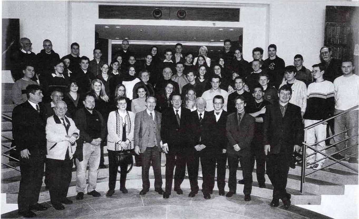
Zu einem Fototermin im 7. Stockwerk des Bundeskanzleramtes (im Zentrum der Macht) empfing Bundeskanzler Gerhard Schröder die Mitglieder des Reichsbanners, sowie die Schülerinnen und Schüler des Weidig Gymnasiums mit ihrem Schulleiter und den Lehrern.