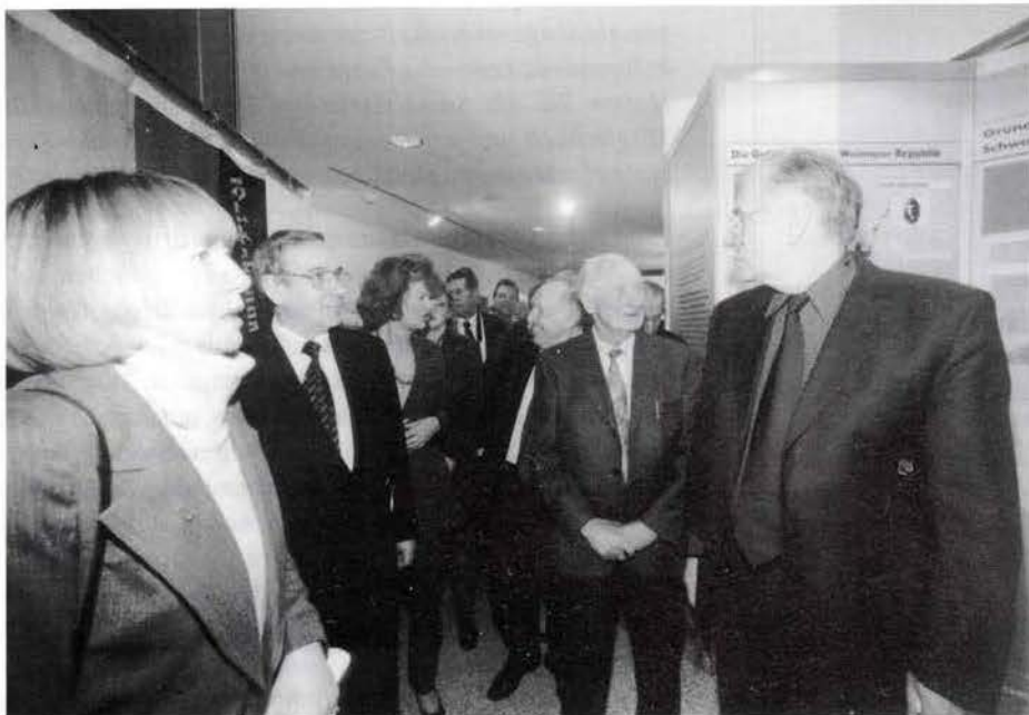
Rundgang durch die Ausstellung