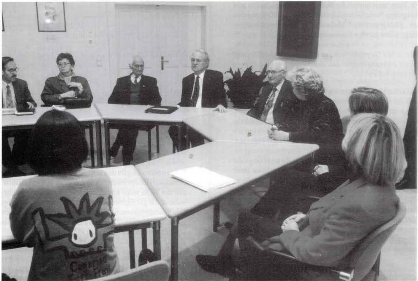
Ministerpräsident a.D., Johannes Rau, in Diskussion mit Auszubildenden der Frankfurter Flughafen AG.