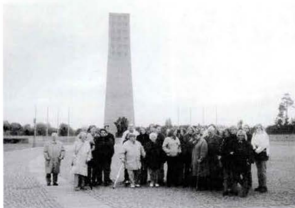
Die TeilnehmerInnen am Mahnmal im KZ Sachsenhausen in Oranienburg

Vom 1. - 5.10.1997 haben wir mit Unterstützung der Bundeszentrale für politische Bildung und in Zusammenarbeit mit dem August-Bebel-Institut ein weiteres Seminar in Berlin durchgeführt. An dem Seminar haben 30 Auszubildende der Frankfurter Flughafen AG und 10 Zeitzeugen der Nazi- sowie der SED-Diktatur teilgenommen. Hierbei hatten insbesondere die jungen Teilnehmer und Teilnehmerinnen die Gelegenheit, bei der Besichtigung der Haftanstalt Hohenschönhausen und