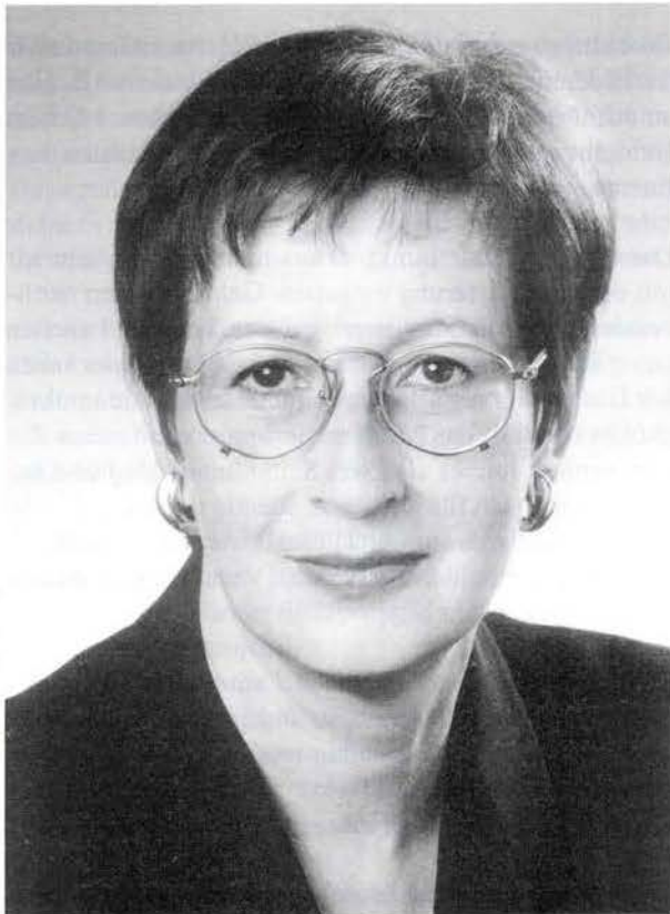
Heide Simonis - Ministerpräsidentin von Schleswig-Holstein

Frage: Die steigende Lebenserwartung der Rentner, die zurückgehende Geburtenentwicklung und die hohe Arbeitslosigkeit bringen die Rentenkasse zunehmend in Schwierigkeit. Muß nicht auch eine von der SPD geführte Bundesregierung eine Kürzung der Renten oder noch höhere Beiträge ins Auge fassen?