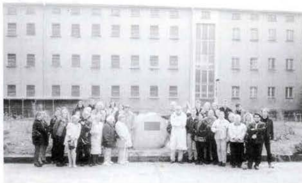
Die TeilnehmerInnen am Gedenkstein in der Haftanstalt Berlin - Hohenschönhausen