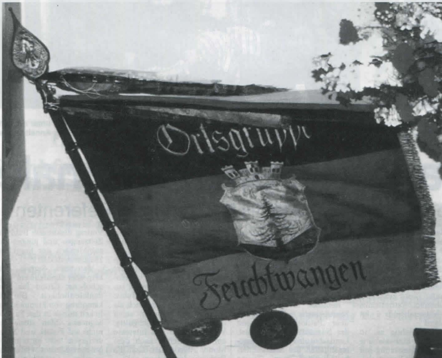
Wieder wurde eine alte Reichsbannerfahne aufgefunden und übergeben: diesmal aus dem früheren Ortsverein Feuchtwangen