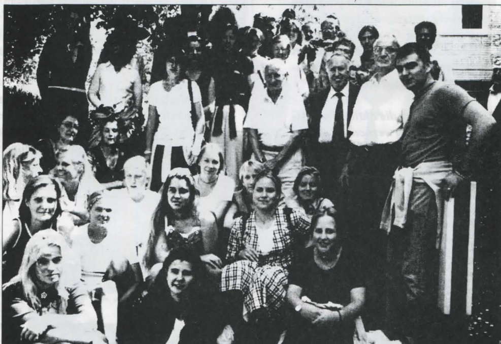
Den zahlreichen Fragen von Zeitzeugen und Jugendlichen stellte sich Ignatz Bubis im Rahmen des Seminars unter dem Thema: „Nationen, Patriotismus und Nationalismus in Deutschland“.