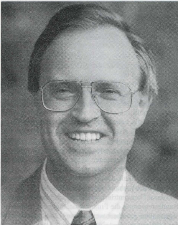
Der Hessische Ministerpräsident Hans Eichel

Frage: Die deutschen Wirtschaftsbosse und auch die Bundesbank vertreten den Standpunkt, daß durch die hohen Lohnforderungen der Gewerkschaften der Wirtschaftsstandort Deutschland gefährdet ist. Dagegen vertreten andere Wirtschaftsfachleute den Standpunkt, daß die Überbewertung der Deutschen Mark in den letzten Jahren mehr zur Gefährdung beigetragen hat. Was ist Ihre Ansicht?