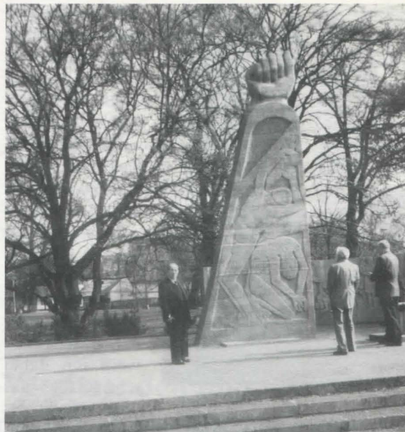
Bundesehrenvorsitzender Alfred Körner an der Gedenkstätte in Köpenick