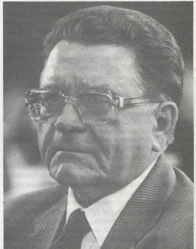
Walter Hesselbach, der neue erste Bundesvorsitzende des Reichsbanner